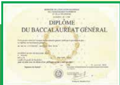
IL DIPLOMA DELL'ESABAC

Si tratta di un percorso di formazione integrato svolto nell'arco di un triennio. Prevede quattro ore di Lingua e letteratura francese a settimana e due ore di Storia, in lingua francese. Per accedere gli allievi devono avere un livello di lingua B1 in francese, e la formazione ricevuta permette loro di raggiungere almeno il B2 al momento dell'esame.